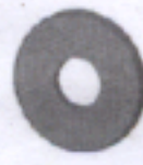
E (2 pz.)