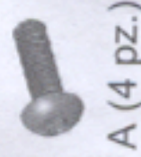
A (4 pz.)